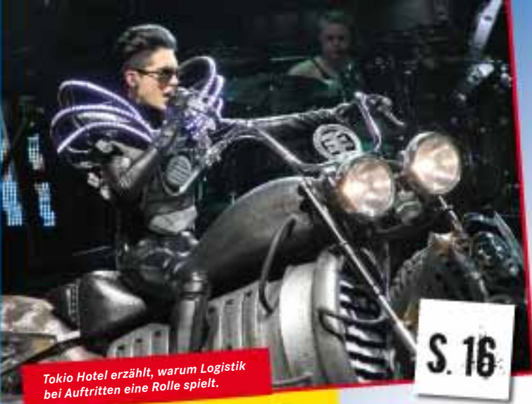
Tokio Hotel erzählt, warum Logistik bei Auftritten eine Rolle spielt.