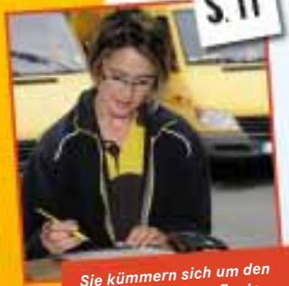
Sie kümmern sich um den Paketversand: Kaufleute für Kurier-, Express- und Postdienstleistungen.