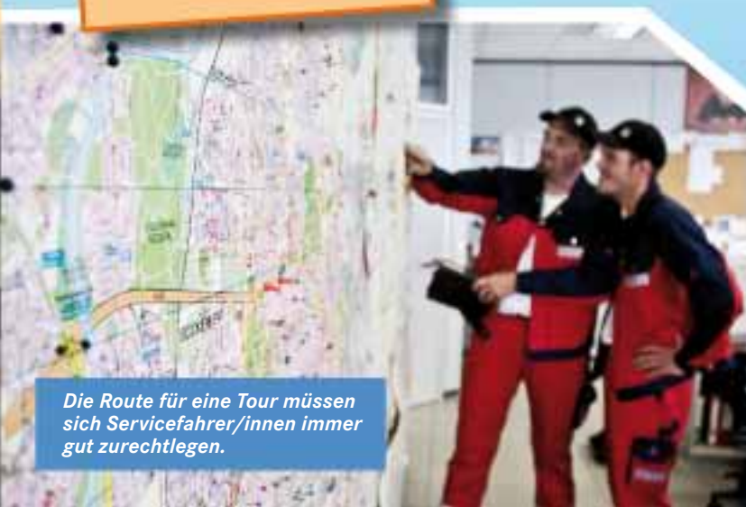
Die Route für eine Tour müssen sich Servicefahrer/innen immer gut zurechtlegen.

Mehr über diesen und weitere Ausbildungsberufe erfährst du auf www.planet-beruf.de » Berufe finden.