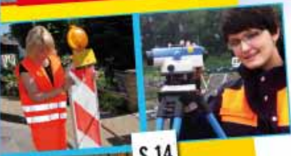
Wer baut Straßen, Gleise und Wasserwege? Hier erfährst du's.