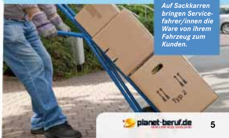
Auf Sackkarren bringen Servicefahrer/innen die Ware von ihrem Fahrzeug zum Kunden.